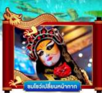
ชมโชว์เปลี่ยนหน้ากาก