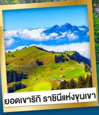
ยอเดาเทอริ ราซีนีแห่งขุนเขา