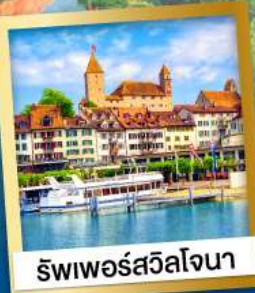
ริวาดีสวิลล์