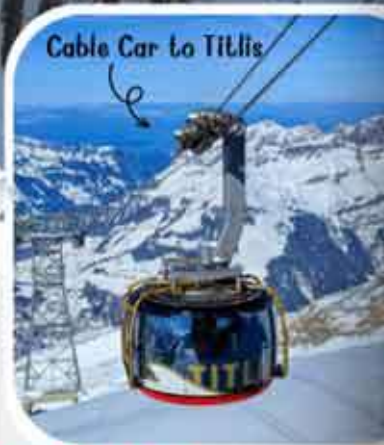
Cable Car to Titlis