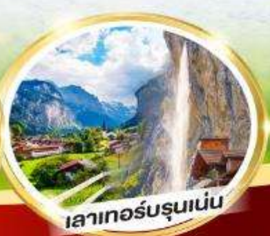
เลาเทอร์บรุนเนน