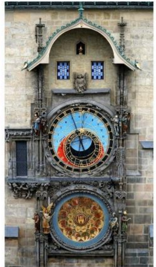
นวมฟาใช้ท์คล็อคเค่นทรัม

นำท่านชม บ่อหมีสีน้ำตาล สัตว์ที่เป็นสัญลักษณ์ของกรุงเบิร์น นำท่านชม มาร์กาสเซ ย่านเมืองเก่า ปัจจุบันเต็มไปด้วยร้านดอกไม้และบูติก เป็นย่านที่ปลอดภัย จึงเหมาะกับการเดินเที่ยวชมอาคารเก่า อายุ 200-300 ปี นำท่านลัดเลาะชม ถนนจุงเคอร์นกาสเซ ถนนที่มีระดับสูงสุดของเมืองนี้ ซึ่งเต็มไปด้วยร้านภาพวาดและร้านขายของเก่าในอาคารโบราณ ชม นวมฟาใช้ท์คล็อคเค่นทรัม อายุ 800 ปี ที่มีโซวให้ดูทุกๆชั่วโมงในการตีบอกเวลาแต่ละครั้ง นวมฟานี้ ในช่วงปี ค.ศ. 1191-1256 ใช้เป็นประตูเมืองแห่งแรก ภายหลังได้ดัดแปลงใช้ท์คล็อคเค่นทรัมให้กลายมาเป็นหอนวมฟาพร้อมติดตั้งนวมฟาดาราศาสตร์เข้าไป