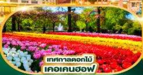
เทศกาลดอกไม้ เคอเคนฮอฟ