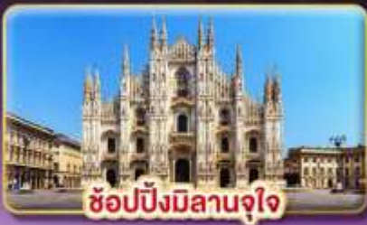
ช้อปปิ้งมิลานจุใจ