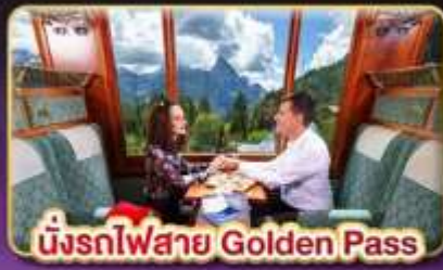
นั่งรถไฟสาย Golden Pass