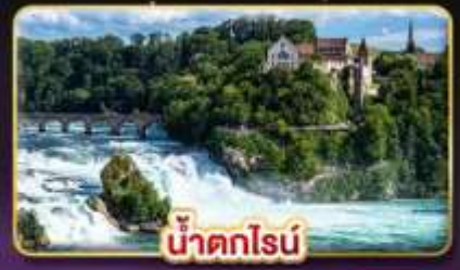
น้ำตกไรน์