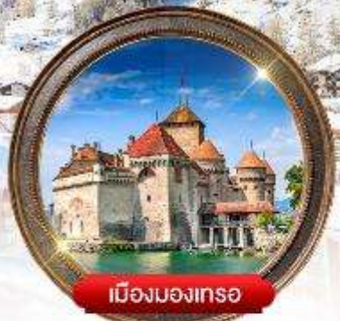
เมืองมงเทรซ