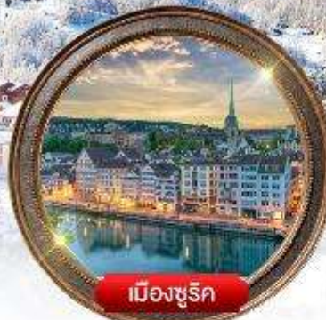
เมืองซูริก