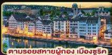
ตามรอยสหราชอาณาจักร เมืองซูริค