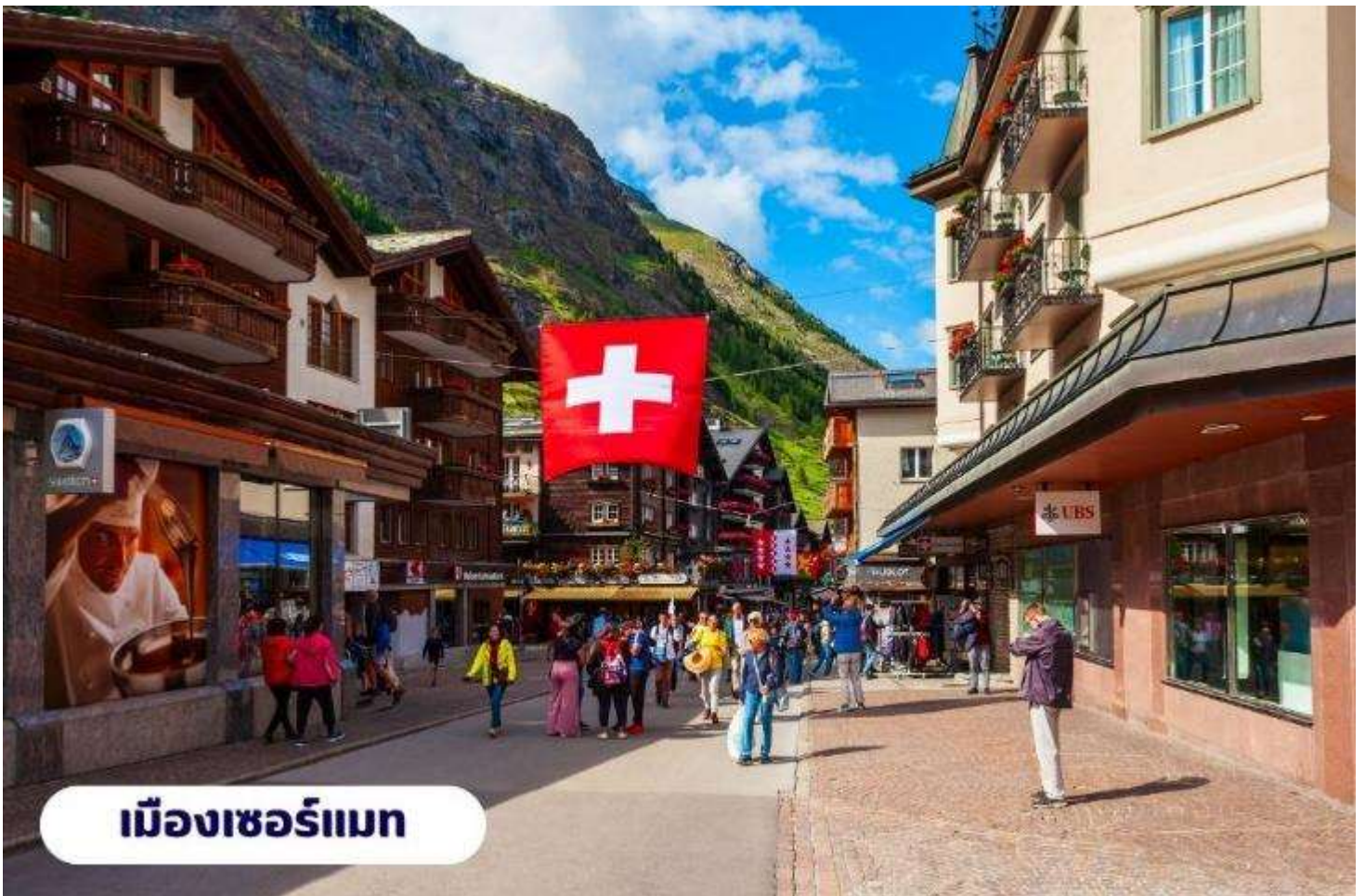
เมืองเซอร์แมท

🕒 บริการอาหารเช้า ณ ห้องอาหารของโรงแรม จากนั้นนำท่านเดินทางสู่ เมืองแทสซ์ (Tasch) ใช้เวลาเดินทางประมาณ 2.30 ชั่วโมง ตั้งอยู่ในประเทศสวิตเซอร์แลนด์ เป็นประเทศขนาดเล็กที่ไม่มีทางออกสู่ทะเล และตั้งอยู่ในทวีปยุโรปตะวันตก ซึ่งมีเทือกเขาแอลป์ ซึ่งเป็นเทือกเขาที่ใหญ่ที่สุดของทวีปยุโรป เลาะเลียบตามหุบเขา ชมทิวทัศน์สวยอันงดงามตลอดเส้นทาง จากนั้นนำท่านเดินทางโดยรถไฟสู่เมืองเซอร์แมท (Zermatt) ใช้เวลาเดินทางประมาณ 15 นาที โดยรถไฟซึ่งเป็นเมืองที่ไม่อนุญาตให้รถยนต์วิ่งและเป็นเมืองที่ได้รับการยกย่องว่าปลอดภัยที่สุดในโลกตั้งอยู่บนความสูงกว่า 1,620 เมตร ซึ่งเป็นที่ตั้งของยอดเขาแมทเทอร์ฮอร์น ซึ่งเป็นสัญลักษณ์ของสวิตเซอร์แลนด์ เมืองเซอร์แมทเป็นเมืองเล็กๆ หรืออาจจะเรียกได้ว่าเป็นหมู่บ้านก็ได้ เพราะว่ามีประชากรในเมืองไม่ถึง 10,000 คน ทางตอนใต้ของสวิตติดกับชายแดนอิตาลี โดยมี Pennine Alps ซึ่งเป็นส่วนหนึ่งของเทือกเขา Alps เป็นเส้นกั้นระหว่าง 2 ประเทศหากพูดถึง Zermatt ก็ต้องนึกถึงยอดเขาแหลมที่มีลักษณะคล้ายปิรามิด ชื่อว่า Matterhorn ที่ตั้งตระหง่านอยู่ใกล้ๆ เมือง มีความสูงถึง 4,478 เมตร สามารถมองเห็นได้จากแทบทุกมุมของเมือง ซึ่ง Matterhorn นี้ถือเป็นสัญลักษณ์ที่สำคัญของ Zermatt