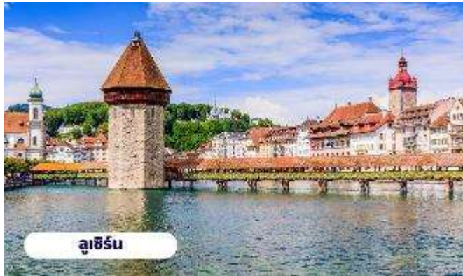
ลูเซิร์น

🕒 บริการอาหารกลางวัน ณ ภัตตาคาร จากนั้นนำท่านเดินทางสู่ เมืองลูเซิร์น ใช้เวลาเดินทางประมาณ 1 ชั่วโมง อดีตหัวเมืองโบราณของสวิสเซอร์แลนด์ เป็นดินแดนที่ได้รับสมญานามว่า หลังคาแห่งทวีปยุโรป (The roof of Europe) เพราะนอกจากจะมีเทือกเขาสูงเสียดฟ้าอย่างเทือกเขาแอลป์แล้ว ก็ยังมีภูเขาใหญ่น้อยสลับกับป่าไม้ที่แทรกตัวอยู่ตามเนินเขาและไหล่เขา สลับแซมด้วยดงดอกไม้ป่าและทุ่งหญ้าอันเขียวชอุ่ม จากนั้นนำท่านชมและแวะถ่ายรูปกับ สะพานไม้ชาเปล หรือสะพานวิหาร (Chapel bridge) ซึ่งข้ามแม่น้ำรอยซ์ เป็นสะพานไม้ที่เก่าแก่ที่สุดในโลก มีอายุหลายร้อยปี เป็นสัญลักษณ์และ