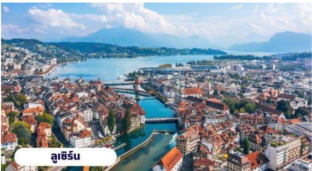
ลูเซิร์น