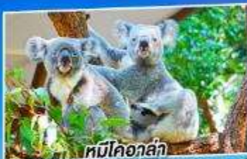
หมีโคอาล่า