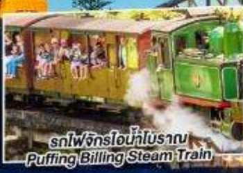
รถไฟจักรไอน้ำโบราณ Puffing Billington Steam Train