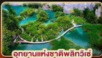
อุทยานแห่งชาติพลิกวิเช