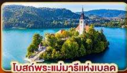
โบสถ์พระแม่มาเรียแห่งเบลด