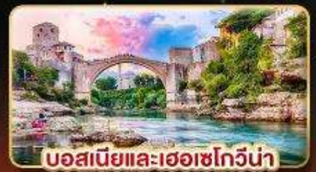
บอสเนียและเฮอร์เซโกวีนา