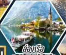
ส่องเรือ ทะเลสาบอัลสติก