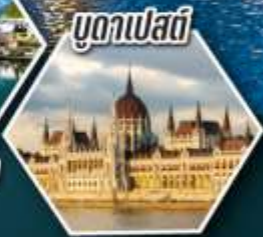
บูดาเปสต์