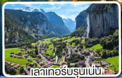
เลาเคอร์บรุนเนน