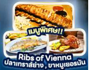
เมนูพิเศษ!! Ribs of Vienna ปลาเทราต์ย่าง, บาหมูเยอร์มัน