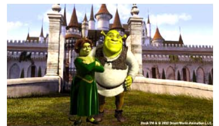
Far Far Away Castle

ปราสาท ฟาร์ ฟาร์ อเวย์ FAR FAR AWAY CASTLE ของฮีโร่ตัวเขียวชเร็ค SHREK แห่งแรกของโลก เป็นปราสาทแห่งแรกในเอเชียที่มีชเร็ค 4D, ให้ท่านได้ร่วมร้องเพลงและพูดคุยกับดองกี้เจ้าตัวละครจากเทคนิค 3D ในห้องรับแขก DONKEY LIVE, ทดลองปรุงสูตรยาพิชที่ร้านของนางฟ้าแม่ทูนหัวด้วยตัวท่านเองที่ เมจิกโพชั่นสปิน MAGIC POTION SPIN, ร่วมสนุกไปกับเที่ยวบินพิเศษ เอนชานท์เต็ดแอร์เวย์ ENCHANTED AIRWAYS