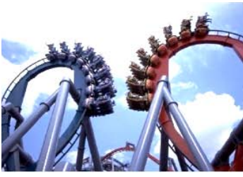
Duelling Roller Coasters

เขย่าขวัญความเร็วสูง การเลี้ยวรุนแรง หมุนควง ถอยหลังกลับอย่างรวดเร็วที่ รีเวนจ์ ออฟเดอะมัมมี่ REVENGE OF THE MUMMY หรือท่องไปในดินแดนแห่งทะเลทราย อียิปต์ต้องห้ามซึ่งเป็นสถานที่ตั้งของสุสานและอารยธรรมโบราณที่ เทอเรเซอร์ฮันเตอร์ TREASURE HUNTERS