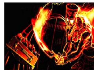
Revenge of the Mummy

อียิปต์โบราณ : ปิรามิดและเสาศินตั้งตระหง่านท่ามกลางเวลา จากยุค 1930 กับการค้นพบสุสานของฟาโรห์และการปลดปล่อยคำสาปอันน่าสะพรึงกลัว สัมผัสเครื่องเล่น